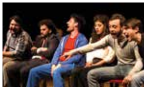
SEMPRE DOMENICA 12 GENNAIO