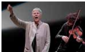
OCCIDENT EXPRESS (HAIFA É NATA PER STAR FERMA) 24 NOVEMBRE