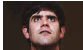
MISTERO BUFFO 21 MARZO