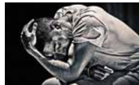
INC INNPROGRESS ATELIER INA / SUITE 2 MARZO