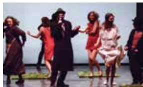
IL RACCONTO D'INVERNO 15 FEBBRAIO