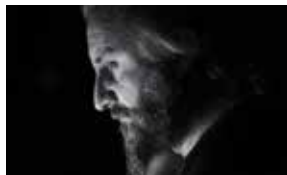
PUEBLO 14 DICEMBRE